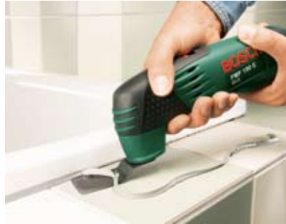
Siliconen voegen uitkrabben.