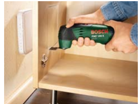
Stuk uit meubel snijden.