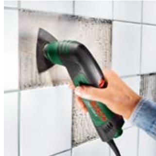
Ondergrond vlak maken.