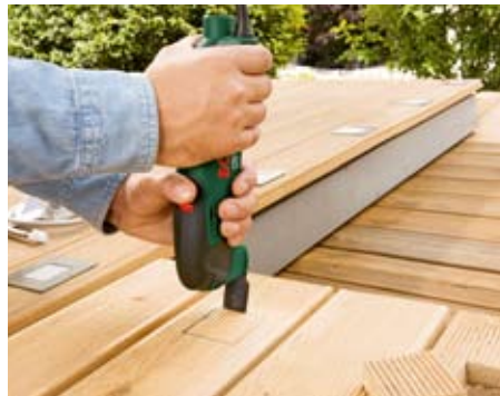
Stuk uit vlondervloer zagen.