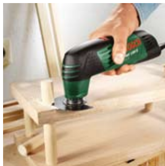
Houten delen verwijderen.