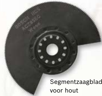
Segmentzaagblad voor hout