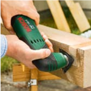
Vijlen bij de carport.

Het HM-Riff deltablad is perfect geschikt om oppervlakken aan te passen. Met het schuuropzetstuk is de PMF 180 E ook uitstekend geschikt voor schuurwerkzaamheden. En omdat de PMF 180 E uitermate licht en handig is, haalt u zonder grote aandrukkracht overtuigende resultaten. Waarbij u overigens weinig stof doet opwaaien, want de PMF 180 E beschikt over een aansluiting voor stofzuigers.